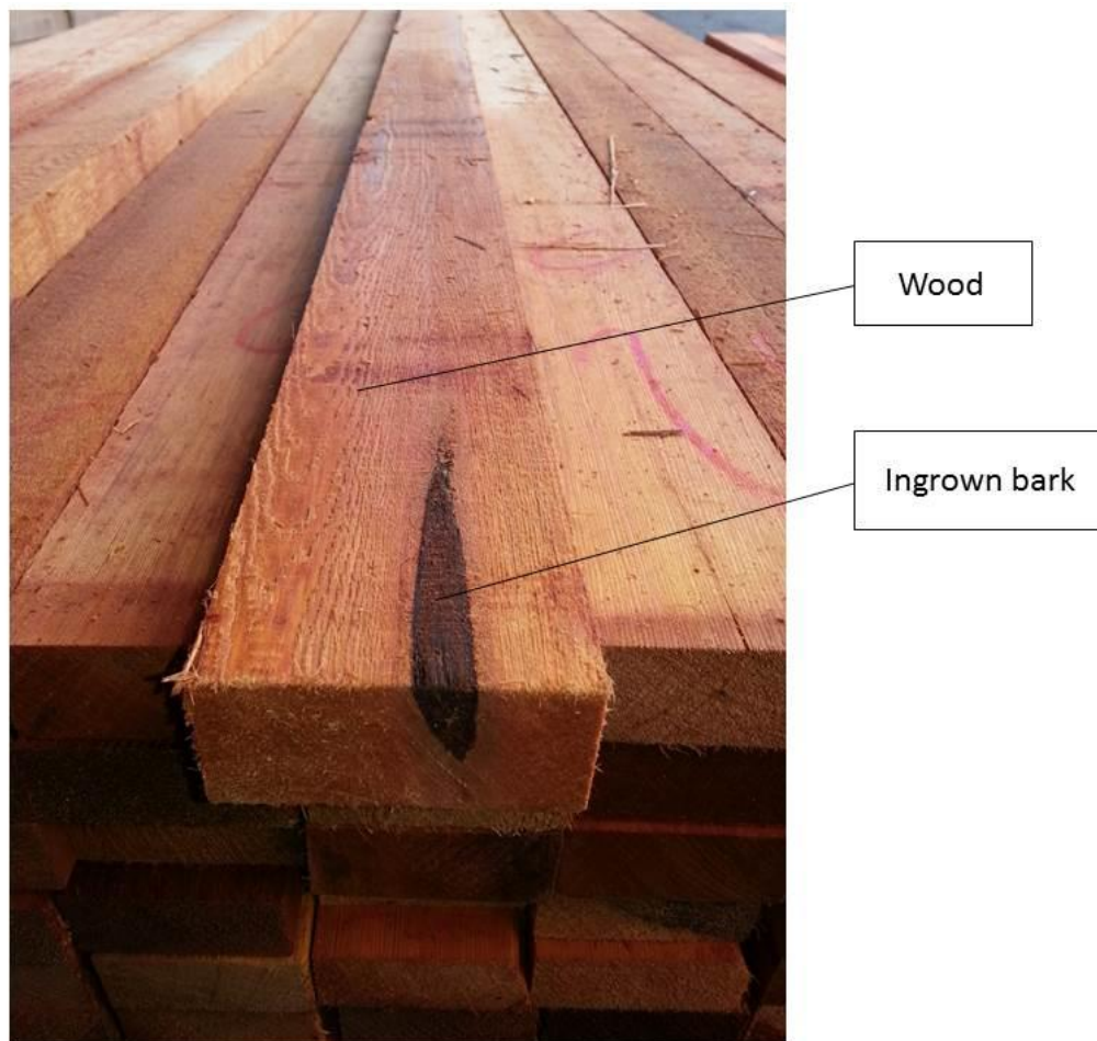
Рисунок 3. Пиломатериалы.